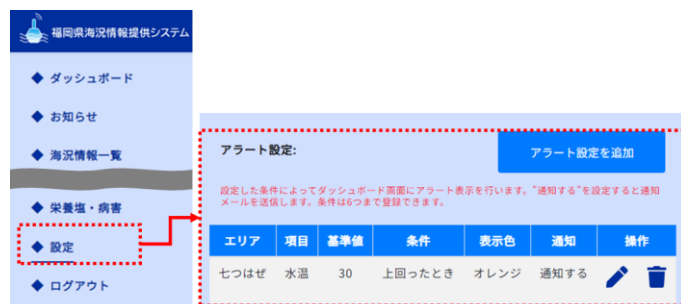
▲会員画面 - 設定 - アラート設定画面